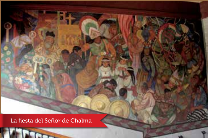
La fiesta del Señor de Chalma

"La fiesta del Señor de Chalma". Encáustica (1923-1924). El tema central de este mural de Jean Charlot (1898-1979), es el sincretismo cultural, propio del nacionalismo mexicano. Conviven en la escena lo profano y lo religioso.