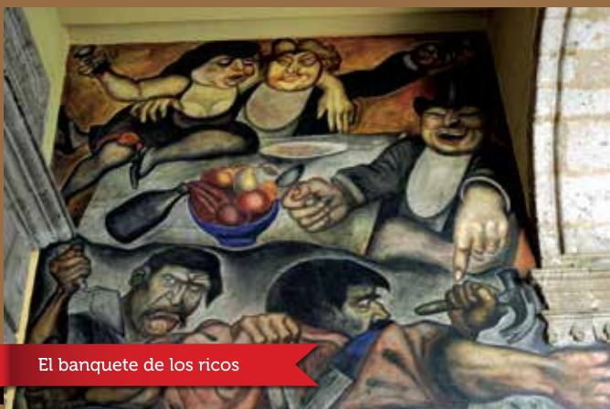
El banquete de los ricos

"La huelga". Fresco (1924-1926). Este tablero sustituyó al Cristo destruyendo su cruz, que formaba parte del primer proyecto de Orozco y del cual sólo decidió dejar la cabeza del Cristo con aureola en la parte central superior. Dos hombres y una mujer sostienen una bandera roja que simboliza el derecho de huelga.