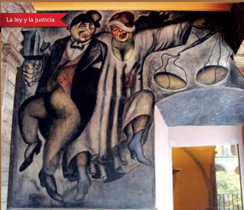
La ley y la justicia

"La ley y la justicia". Fresco (1923-1924). En esta obra de Orozco, dos figuras bailan en aparente estado de ebriedad: el hombre que personifica la ley hace un guiño a la dama cuya actitud simboliza la justicia ciega y desequilibrada.