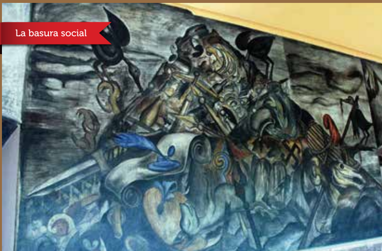
La basura social

"La basura social". Fresco (1923-1924). En esta obra Orozco acumuló algunos símbolos del poder y esqueletos de hombres y animales, simbolizando el basurreo de la vanidad y del poder; sobre él se posan tres aves de rapiña.