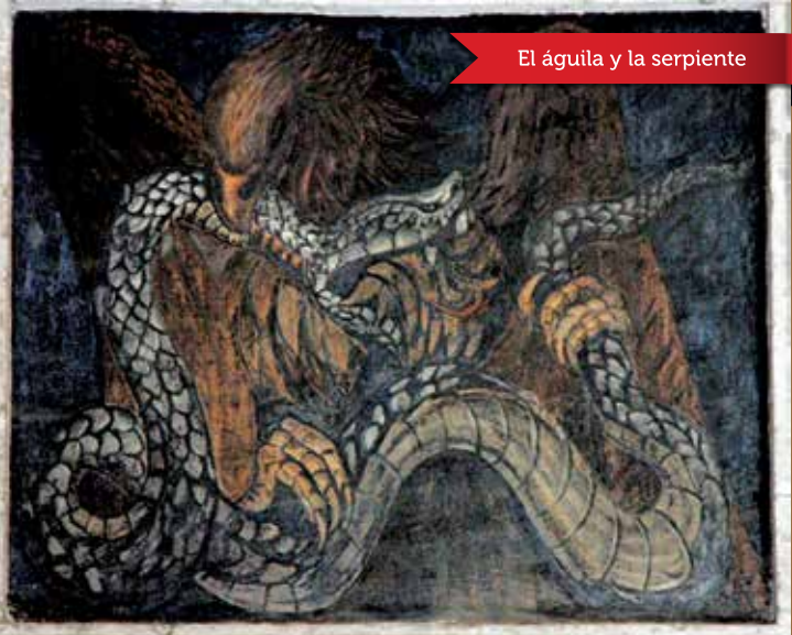
El águila y la serpiente

Otra de las obras de Jean Charlot (1898-1979), fue "El águila y la serpiente", como parte del mural "La conquista de Tenochtitlán" (1922-1923), en el Colegio de San Ildefonso.