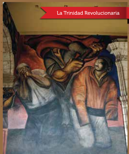
La Trinidad Revolucionaria

"El banquete de los ricos". Fresco (1923-1924). Orozco plasmó una crítica social recurriendo a los dibujos caricaturescos de la prensa de la etapa revolucionaria; la línea horizontal que marca dos planos señala la división de las clases sociales.