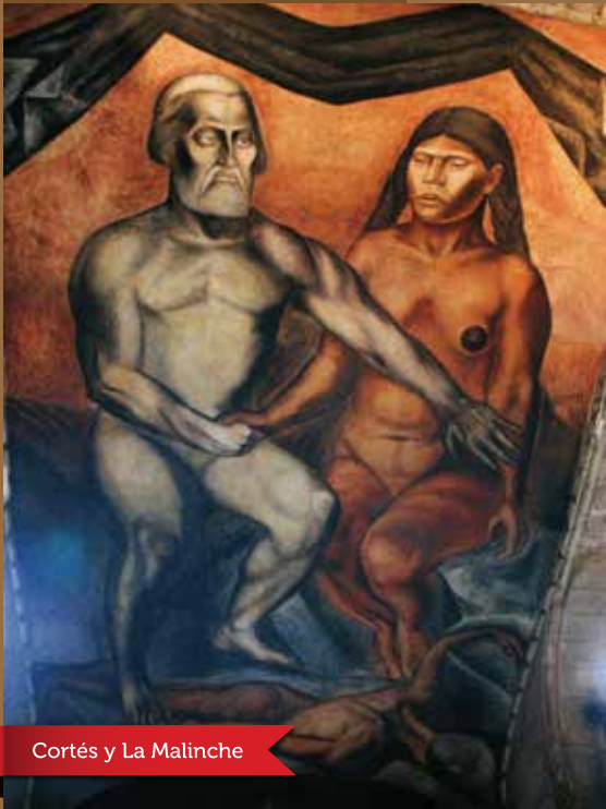
Cortés y La Malinche

"Cortés y La Malinche". Fresco (1923-1926). Este mural de José Clemente Orozco es una de las obras más significativas del Antiguo Colegio de San Ildefonso y representa a la raza vencida, simbolizada por una figura de tez morena, de la cual surge el mestizaje a través de la unión de los dos personajes desnudos: Cortés, en actitud dominante, y La Malinche, con los ojos cerrados en actitud sumisa y pasiva.