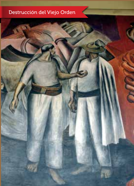
Dstrucción del Viejo Orden

Fresco (1923-1926), en esta obra de Orozco encontramos a dos hombres firmes y robustos que voltean la mirada hacia el segundo plano, compuesto por formas arquitectónicas confusas que dan la sensación de desplomarse. La solidez de las figuras masculinas sugiere la estabilidad a la que aspira el México posrevolucionario, que contrasta con el pasado, en proceso de destrucción.