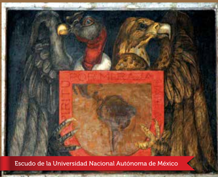
Escudo de la Universidad Nacional Autónoma de México

Este vitral emplomado fue elegido por catálogo y encargado al Real Establecimiento de Baviera F. X. Zettler de Munich, Alemania en 1899, con el fin de proporcionar más luz a la circulación del Colegio de San Ildefonso.