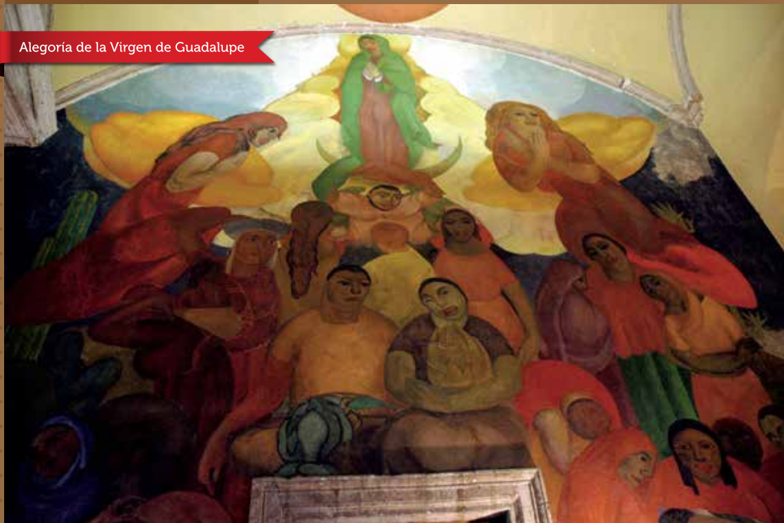
Alegoría de la Virgen de Guadalupe

En 1922 y 1923, Fermín Revueltas (1903-1935) pintó el mural representativo de una tradición muy mexicana: la veneración a la Virgen de Guadalupe, en la entrada del "patio grande" del Colegio de San Ildefonso y lo tituló "Alegoría de la Virgen de Guadalupe".