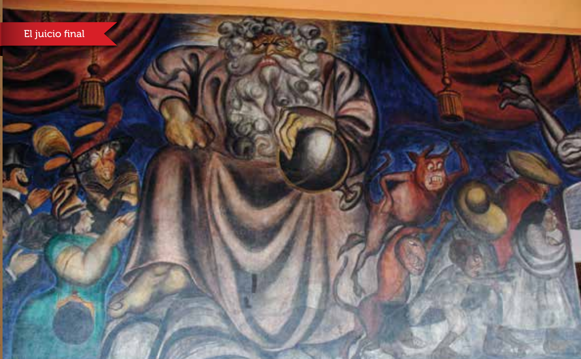
El juicio final

"El juicio final". Fresco (1923-1924). Obra de Orozco, que es una representación irónica de un dios que sostiene el mundo sobre su regazo. A cada lado dos grupos perfectamente diferenciados: los ricos con aureolas y los pobres perseguidos por los demonios.